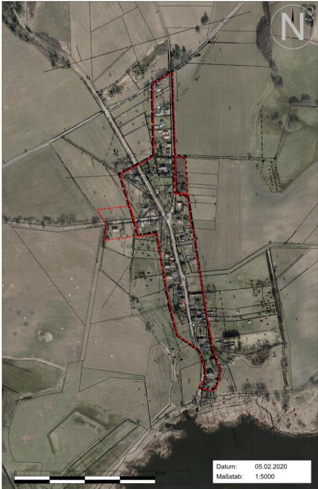
Anlage B: Geltungsbereich für den Ortsteil Gummlin