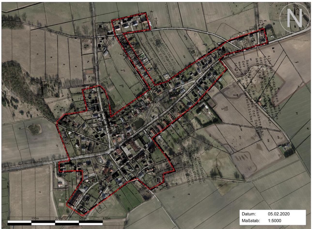
Anlage A: Geltungsbereich für den Ortsteil Stolpe