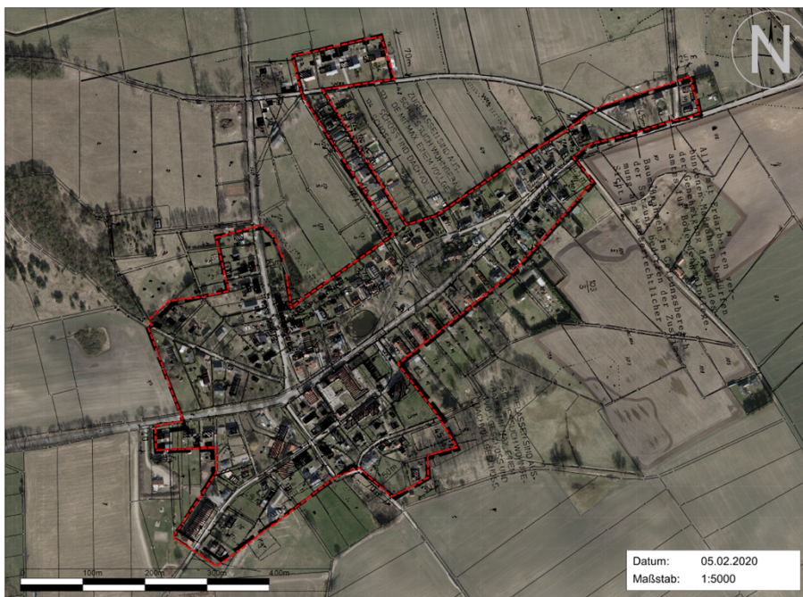
Geltungsbereich für den OT Stolpe

Der räumliche Geltungsbereich ist identisch mit jenen der rechtskräftigen „Klarstellungssatzung mit Abrundungen nach § 34 Abs. 4 Satz 1 und 3 BauGB für das Dorf Stolpe/Gemeinde Stolpe“ und der „Klarstellungssatzung mit Abrundungen nach § 34 Abs. 4 Satz 1 und 3 BauGB für das Dorf Gummlin/Gemeinde Stolpe“ und ihrer 1. und 2. Ergänzung.