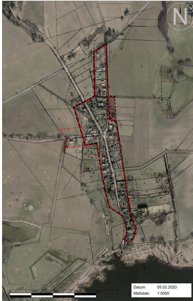
Geltungsbereich für den OT Gummlin