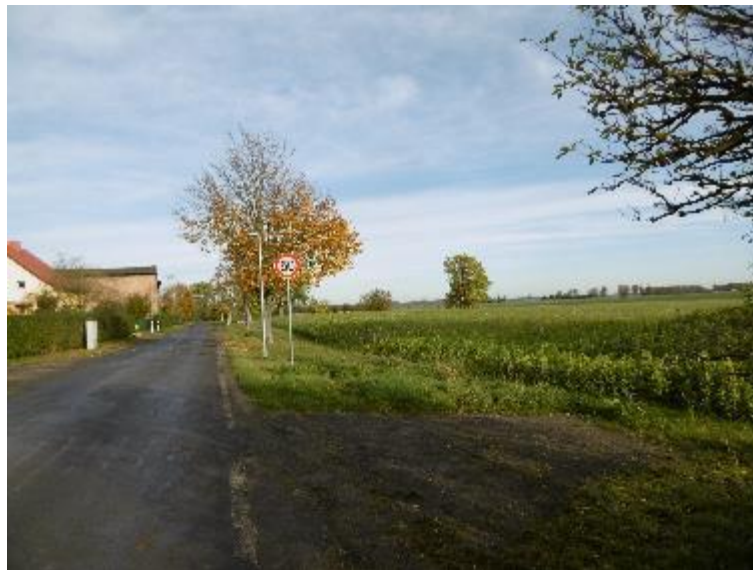
Foto 3: Das Ergänzungsgebiet wird von landwirtschaftlichen Nutzungen geprägt. Entlang der Straße befindet sich eine Linden-Baumreihe.

Entlang der Straße befinden sich im Bereich der Flurstücke 99 und 100 einzelne Linden, die als Kopfbäume gepflegt werden. Eine Alleenstruktur ist in Ansätzen erkennbar, so dass die Belange des Alleenschutzes gemäß den textlichen Festsetzungen (I.4. Pkt. 7) und Hinweisen (Pkt. 3) in die Planungen einzustellen sind.