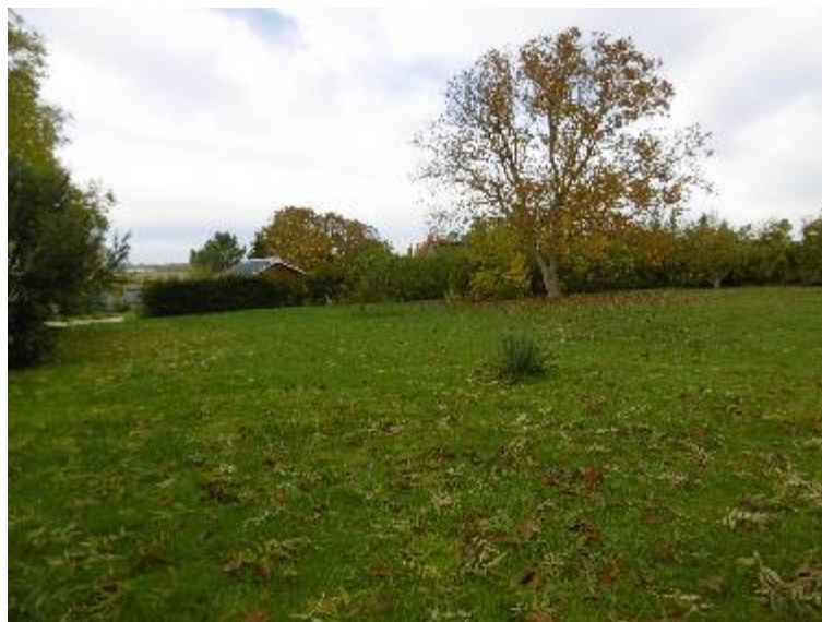
Foto 5: Die Flurstücke 29 und 30 weisen vorwiegend Zierrasenvegetationen auf. Markant ist eine Walnuss im nördlichen Bereich des Flurstücks 30, die gemäß § 18 NatSchAG M-V gesetzlich geschützt ist.

Das Flurstück 35 hat aufgrund der Auflassung ruderalen Charakter. Hier hat sich eine Flur mit Landreitgras flächenhaft ausbreiten können.