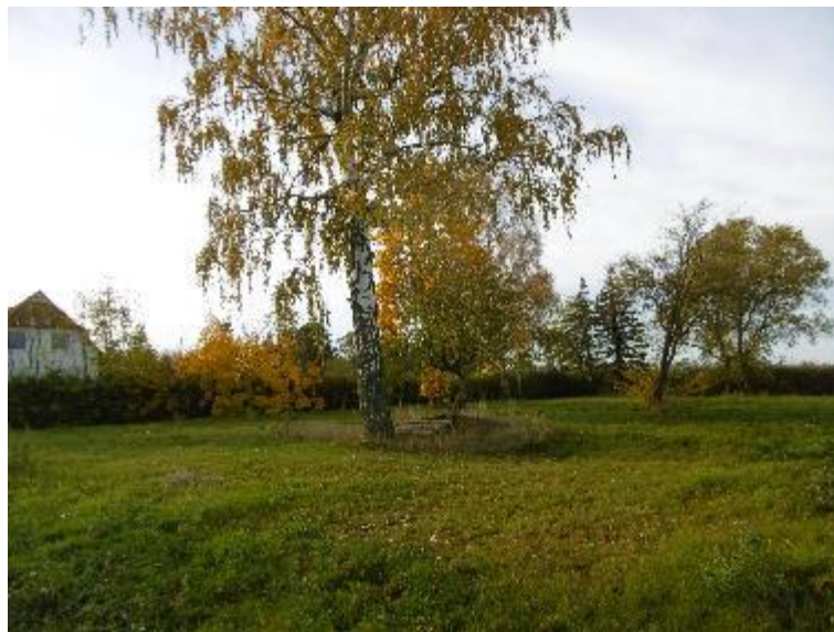
Foto 1: Randständig und mittig der Flurstücke 1/2 und 1/3 befinden sich u. a. Einzelbaumbestände, die gemäß § 18 NatSchAG M-V gesetzlich geschützt sind.

Die Flurstücke 1/2 und 1/3 sind von einer frei wachsenden Hecke mit Bestand an Schneebeeren sowie teilweise eingestreuten Brombeeren, Wildrosen und Gehölzinitialen aus Ahorn umgeben. In den artenreichen Wiesenflächen wurden einzelne Obstbäume erfasst. Mittig und randständig der Flurstücke befinden sich Birken, Berg-Ahorn sowie eine Silber-Weide. Einzelne Bäume weisen Stammumfänge von mehr als 100 cm, gemessen in einer Höhe von 1,30 m ab Erdboden, auf und sind demzufolge gemäß § 18 NatSchAG M-V gesetzlich geschützt. Die Belange des gesetzlichen Gehölzschutzes sind gemäß den textlichen Festsetzungen (l.4. Pkt. 6) und Hinweisen (Pkt. 2) bei der Umsetzung der Planungen zu berücksichtigen.