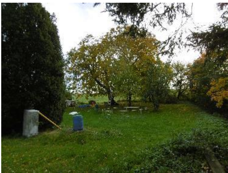
Foto 4: Auf dem Flurstück 72 befindet sich eine markante ältere Walnuss mit weit ausladender Krone. Auch eine Eibe ist erhaltenswert. Eine Bebauung ist nur unter Berücksichtigung des Baumbestandes vorzunehmen.

Auf dem Flurstück 72 befindet sich fast mittig des Grundstücks ein alter Walnussbaum mit einer weit ausladenden Krone. Die Walnuss unterliegt als besondere Baumart und in Anbetracht des Stammumfanges dem gesetzlichen Gehölzschutz gemäß § 18 NatSchAG M-V. Auf den Flurstücken wurden weitere Bäume erfasst, die den Kriterien des gesetzlichen Einzelbaumschutzes entsprechen. Besonders erhaltenswert ist auch eine Eibe an der nördlichen Grenze des Flurstücks 72. Die Belange des gesetzlichen Gehölzschutzes sind gemäß den textlichen Festsetzungen (I.4. Pkt. 6) und Hinweisen (Pkt. 2) bei der Umsetzung der Planungen zu berücksichtigen. Eine Bebauung ist nur unter Berücksichtigung der Einschränkungen aufgrund des Gehölzbestandes vorzunehmen.