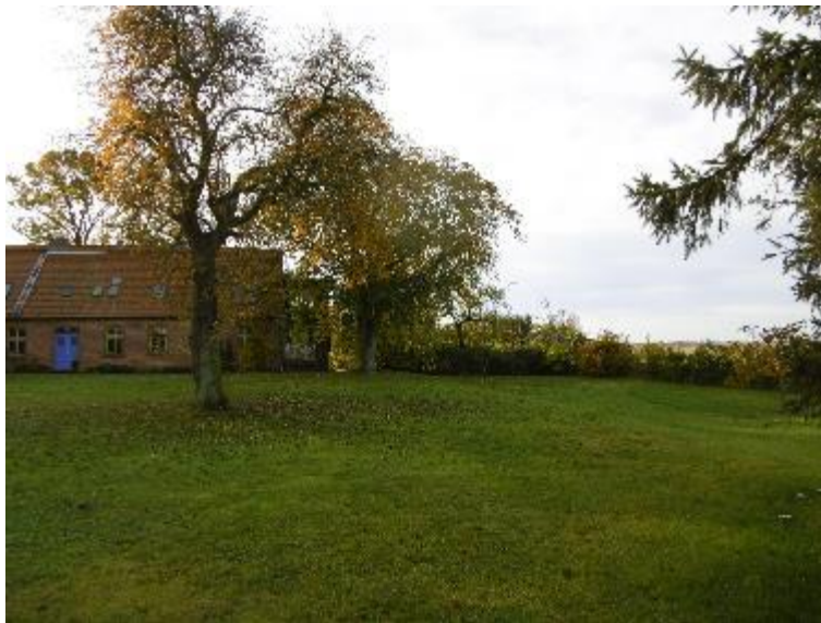
Foto 2: Der nördliche Teil des Flurstücks 48 weist artenreiche Zierrasenvegetationen mit eingestreuten Obstgehölzen auf. Hier im Bild ein markanter älterer Birnbaum.

Das Ergänzungsgebiet 2 weist vorwiegend artenreiche Zierrasenvegetationen mit eingestreuten Obstgehölzen auf. Markant bezüglich des Kronenhabitus ist mittig des Ergänzungsgebietes eine ältere Birne. Im Westen ist das Plangebiet von einer Hecke aus Flieder, Hainbuche und einzeln eingestreutem Holunder begrenzt. Die nördliche Begrenzung bilden Fichtenbestände. Der nordöstliche Bereich des Ergänzungsgebietes weist Strauchbestände mit Haselnuss, Hainbuche und Schneebeere auf und wird teilweise gärtnerisch genutzt.