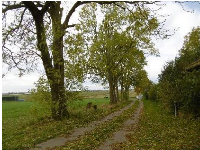
Foto 6: Südlich des Plattenweges befindet sich eine gesetzlich geschützte Baumreihe. Der Schutz der Allee ist bei den Planungen zu berücksichtigen.

Zu verweisen ist auf eine gesetzlich geschützte Baumreihe aus Eschen südlich des Plattenweges, der an das Planänderungsgebiet anschließt. Die Belange des Alleenschutzes gemäß § 19 NatSchAG M-V sind gemäß den Hinweisen (Pkt. 3) bei den Planungen zu berücksichtigen.