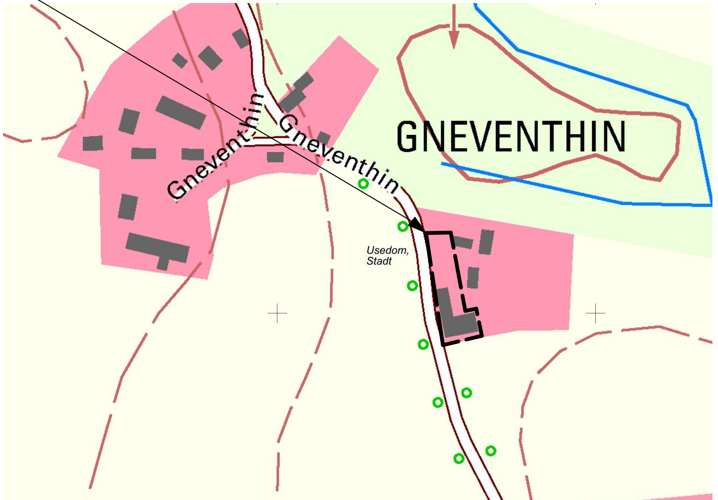
Übersichtsplan M 1: 3.000