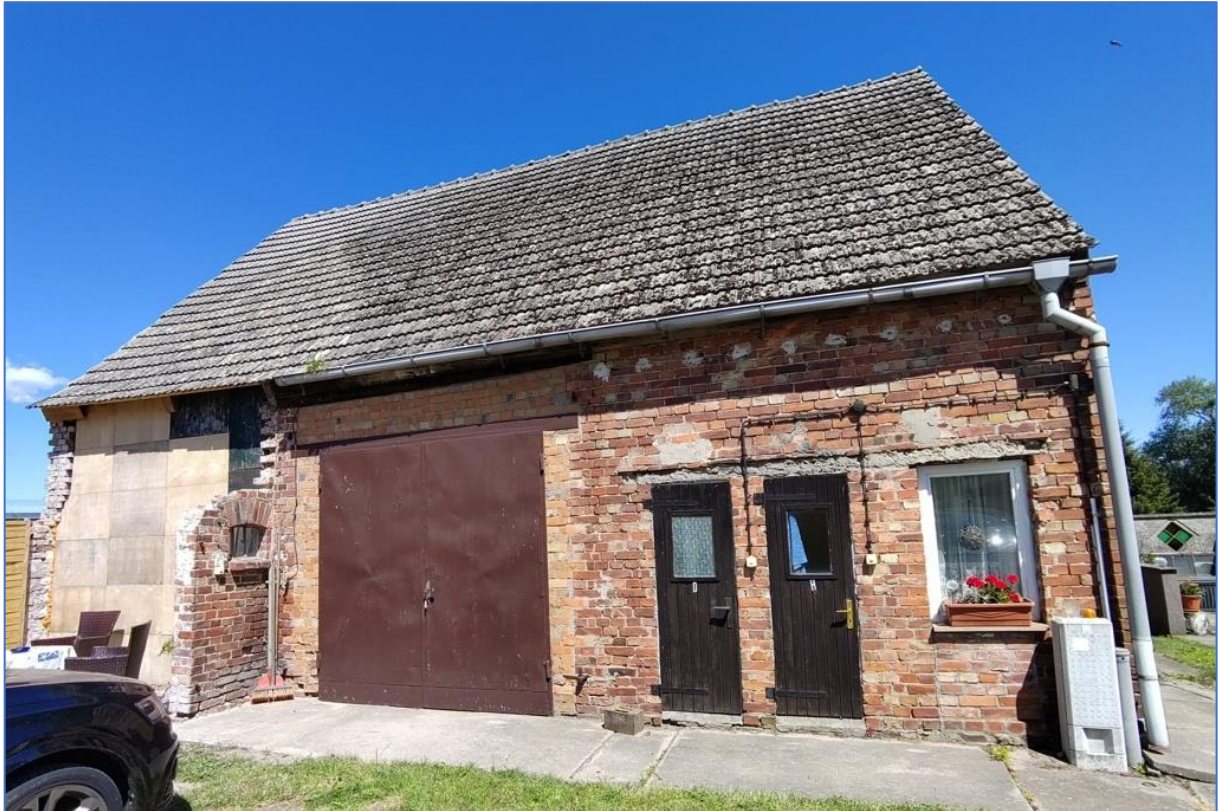
Abb. 1 zum Abbruch vorgesehenes Gebäude

BV: 1. Ergänzung und 3. Änderung Bebauungsplan Nr.12 "Am Balmer See" der Gemeinde Benz, Ortsteil Balm