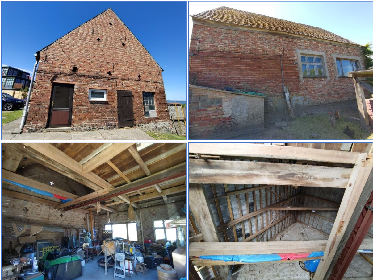
Abb. 2 bis 5 Ansichten des Gebäudes

Die Gebäudekontrolle erfolgte am 12. Juli 2022. Für die Suche nach Besiedlungsspuren wurden Fernglas, Kamera und Strahler genutzt. Außerdem standen Leiter, Endoskope, Fledermausdetektor etc. zur Verfügung.