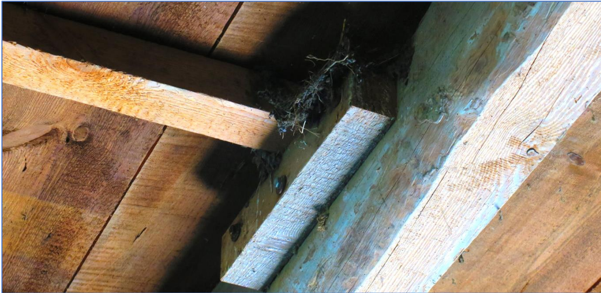
Abb. 6 Nestreste - Rauchschwalbe